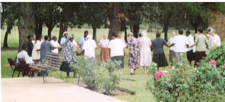
Caminar sobre la tierra