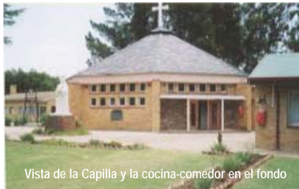
Vista de la Capilla y la cocina-comedor en el fondo

Africa del Sur fue el país anfitrión para la reunión de los cuatro Consejos de Africa y de las dos representantes de las comunidades de Ruanda y Uganda. La reunión se hizo en La Verna, un centro de retiros y conferencias que pertenece a los franciscanos, y que está a una hora de coche al Sur de Johannesburg. Es un sitio ideal para reuniones, situado entre bosques, en el