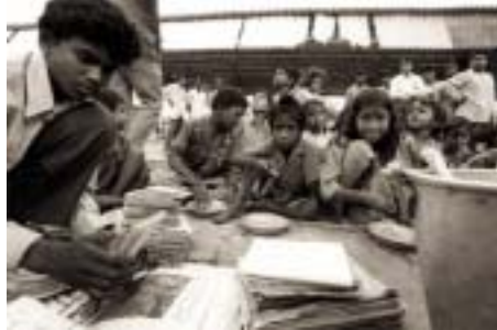
Niños obreros en la India

¿Quiénes son los niños de la calle? Ya conocemos un poco este tema. Hay niños que se escapan de su casa por varias razones: algunos proceden de