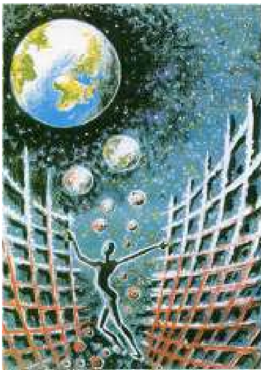
Tráfico de mujeres y niños Información y material de trabajo

El prólogo del documento, del que hablamos más abajo, explica la finalidad y el contenido del documento.