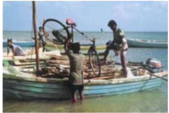
Regresando en barca

cumplir su misión tradicional - ofrecer protección física y legal a las poblaciones civiles afectadas por la guerra, financiar una gama de